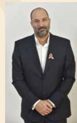
Erzsébetváros Sportjáért MACCABI VAC Hungary sportegyesület

Első versenye 2010-ben volt, a Fitparádén indult, 2011-ben részt vett az Arnold Classic versenyen Amerikában, és ugyanebben az évben az Ausztria Kupán is első helyen végzett. 7 éve aktívan versenyez, háromszoros világ bajnok és kétszeres Európa-bajnok, illetve többszörös magyar bajnok fitneszversenyző és -edző.