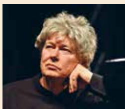
Erzsébetváros Díszpolgára (posztumusz)

Az Erzsébetvárosi Kéttannyelvű Általános Iskola diákja volt. Az iskola 3. és a 6. osztályos diákjai a nevével fémjelzett sportakadémia szervezésében járnak úszásoktatásra. Kilencéves korában kezdett vízilabdázni, 16 évesen már tagja volt a férfi felnőtt válogatott keretének. Posztja jobb szélső, bal kezes, erőteljes lövéseit az egész világ ismeri.