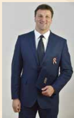
Erzsébetváros Díszpolgára Dr. Kiss Gergely háromszoros olimpiai bajnok magyar vízilabdázó, jogász

Az Erzsébetvárosi Kéttannyelvű Általános Iskola diákja volt. Az iskola 3. és a 6. osztályos diákjai a nevével fémjelzett sportakadémia szervezésében járnak úszásoktatásra. Kilencéves korában kezdett vízilabdázni, 16 évesen már tagja volt a férfi felnőtt válogatott keretének. Posztja jobb szélső, bal kezes, erőteljes lövéseit az egész világ ismeri.